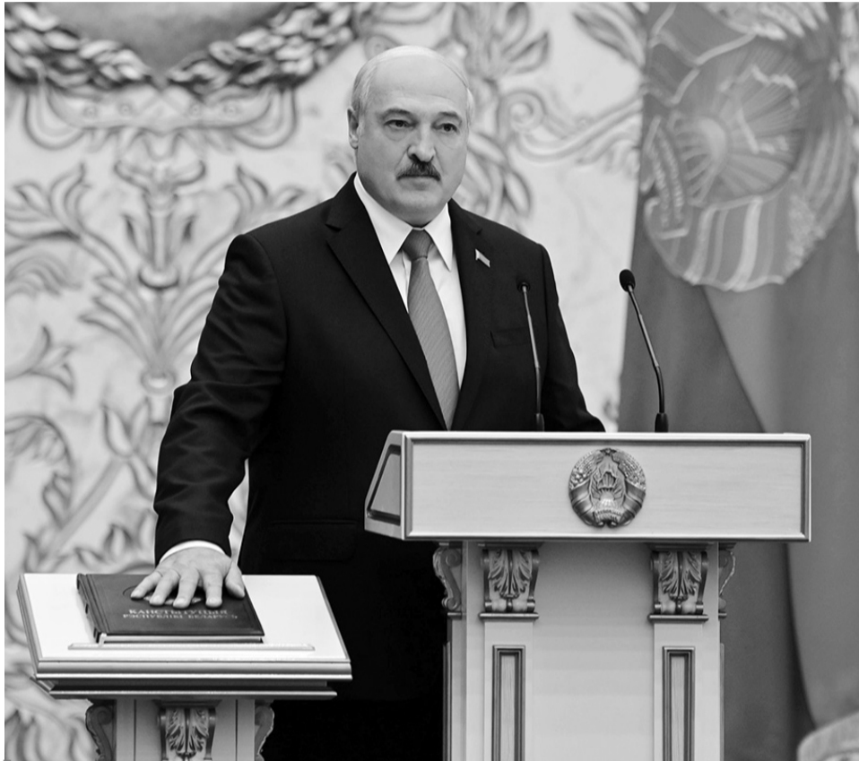
«Президент», який ховається від народу.