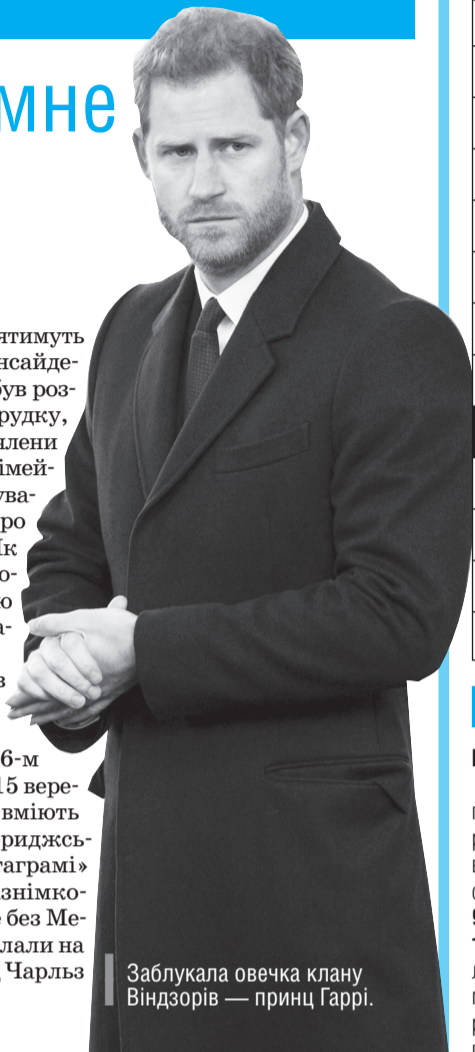
Заблукала овечка клану Віндзорів — принц Гаррі.

Сімейний клан Віндзорів вирішив тонко «віддячити» своєму «заблудлому» родичу і привітав Гаррі з його 36-м днем народження, яке було 15 вересня, тонким тролінгом, як це вміють британці. Так, герцоги Кембриджські поздоровили брата в «Інстаграмі» і виклали фото, на якому зазнамкована пара разом із Гаррі, але без Меган Маркл. Подібні фото виклали на своїх сторінках також принц Чарльз і королева Єлизавета. ■