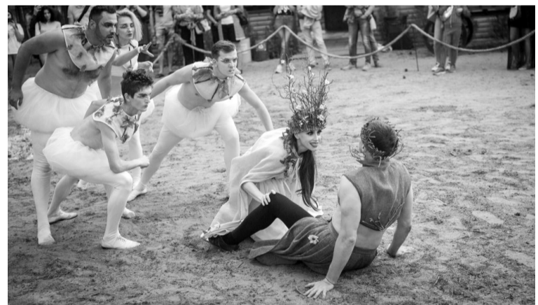
«Сон літньої ночі».

Відсутність вікон, омиті дощами стіни й бита цегла під ногами були докором для посадовців, котрі неспроможні захистити від дощової руйнації саму будівлю,