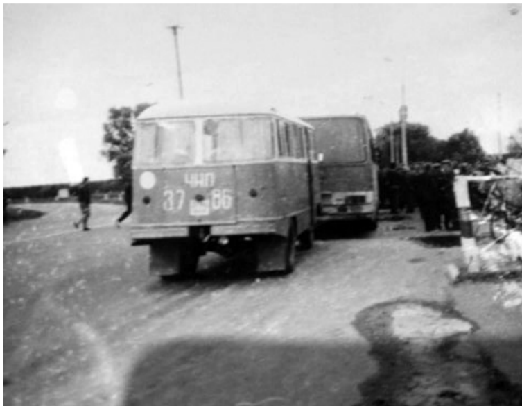
Так було заблоковано «Ікаруси» з київським хором «Гомін» у Кіптях 22 вересня 1990 року.