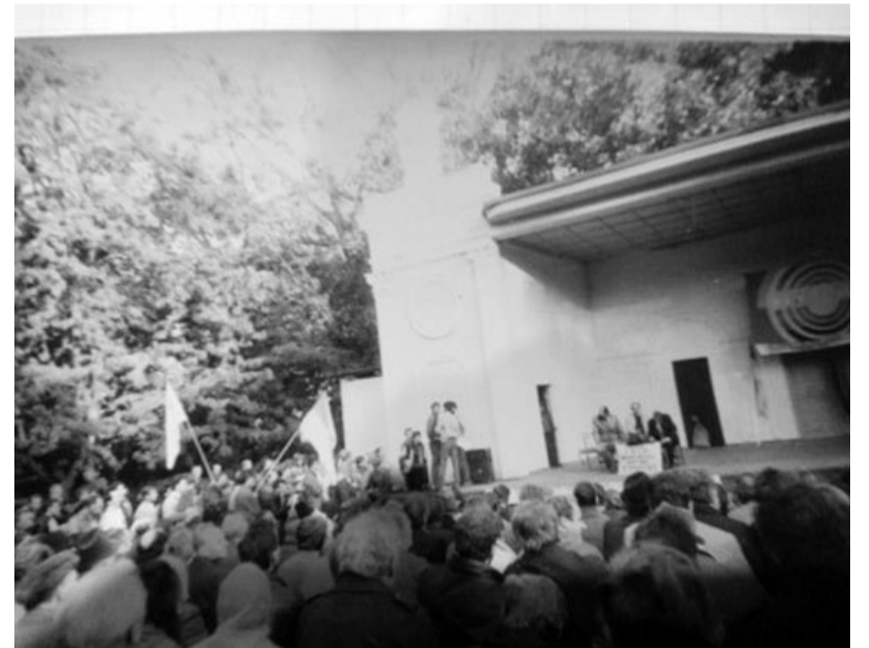
Збори патріотів у Літньому театрі на чернігівському Валу 23 вересня 1990 року.