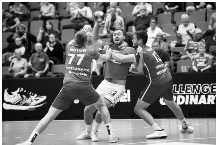
Гандболістам «Мотора» не вдалося нав'язати боротьбу швидким візаві з «Ольборга».

Наскільки ж успішно та продуктивно відбувається процес становлення нової команди в Запоріжжі (у міжсезоння «Мотор» залишили четверо досвідчених виконавців, ще двоє ключових гравців зазнали серйозних травм), мав продемонструвати візитний поєдинок проти данського «Ольборга». Під час попередніх «лігочемпіонських» сезонів «Мотор» частенько зустрічався з чемпіоном Данії, кілька разів досягши в тих протистояннях позитивного для себе результату. Утім цього разу данський колектив завдав «мотористам» болісного