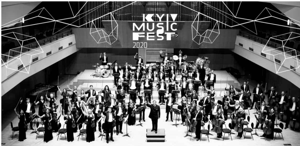
Традиційно відкриває і закриває «Київ Музик Фест» Національний симфонічний оркестр України під орудою диригента Володимира Сіренка.

Загалом у рамках фестивалю відбудеться 18 концертів симфонічної, хорової, камерної, та електроакустичної музики. Прозвучать прем'єри сучасних українських композиторів: Сергія Пілюгікова, Золтана Алмаші, Олександра Щетинського, Леоніда Грабовського, Валентина Сильвестрова, Євгена Станковича та інших.