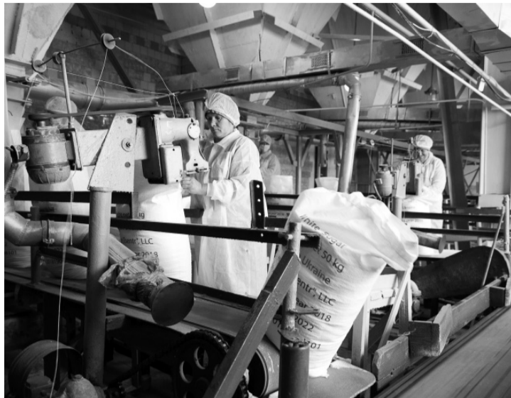
Цукровий бізнес в Україні стає все менш і менш рентабельним.

Усього ж у нинішньому сезоні в нашій державі мають працювати 33 цукрові заводи — таким чином, за рівнем виробництва ми залишаємося на рівні минулого року. Всього ж, за підрахунками профільної асоціації, які вона оприлюднила ще перед початком сезону, у 2020/2021 маркетинговому році виробництво цукру, ймовірно, становитиме 1,2-1,3 млн тонн. Це на 15% менше, ніж у минулому році. Причиною тому, на думку галузевих експертів, стала аномальна погода в Україні. Зокрема, посуха в більшості регіонів України, через яку на полях утворилася ґрунтова кірка, що ускладнює процес