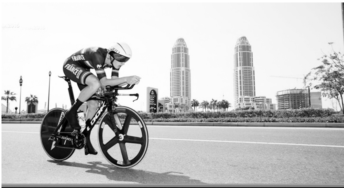
На чемпіонаті світу в Досі велогонщикам, окрім суперників, доводиться боротися ще й зі страшенною спекою.

На чемпіонаті світу в Досі велогонщики потерпають від неймовірної спеки