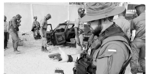
Іспанська цивільна гвардія в дії.

Іспанська поліція звинувачує українських моряків у співпраці з терористами