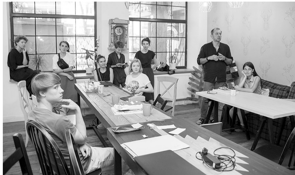
Митці з Галичини представляють проекти у Харкові.

Культурний форум об'єднує Слобожанщину і Галичину