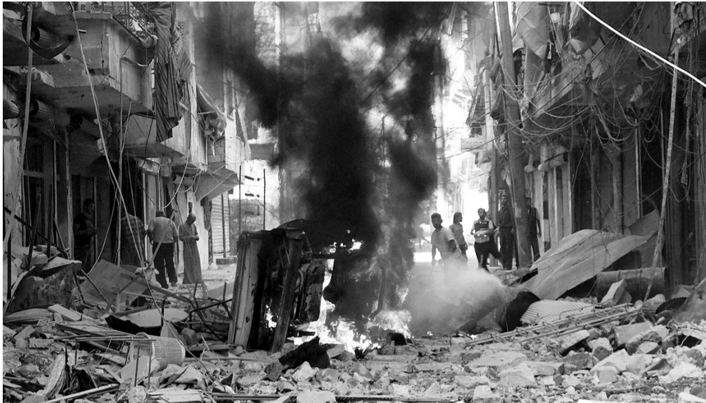
Жахливі наслідки «миротворчої місії» росіян у Сирії.

Апетити Кремля з освоєння чужих територій зростають