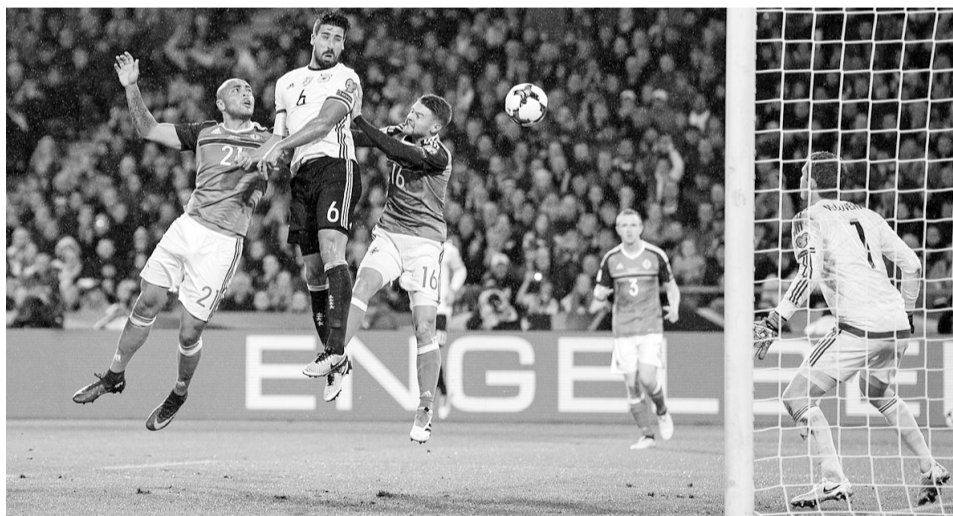
Без особливих зусиль німецька збірна переграла суперника з Північної Ірландії.

Чинні чемпіони світу одні з небагатьох, кому без втрат вдалося пройти перші три тури відбору на «мундіаль-2018»