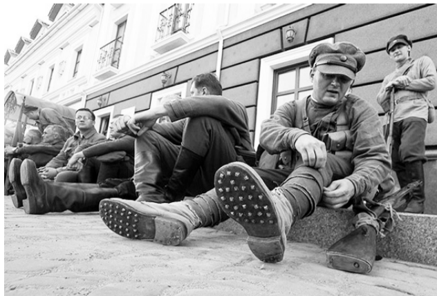
Реконструктори не раз відтворювали події 1919 року.

У рамках фестивалю 15 жовтня у Вінниці відтворять бій армії УНР із білогвардійцями 1919 року. «Майже 70 реконструкторів з Вінниці, Києва, Одеси, Хмельницького та Чернігова зберуться у центрі Вінниці. Вони вперше в Україні спробують повторити бій між українськими військами та «денікінцями». Ще 20 професійних акторів драмтеатру покажуть соціально- побутове життя Вінниці того часу: весілля, прогулянки