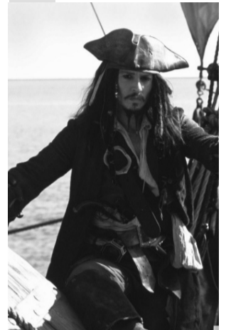
21.00 X/ф «Пирати Карибського моря: скриня мерця» 00.00 X/ф «Жах Амівілля»

03.00, 1.50, 2.55 Зона ночі 03.15 Абзац 04.10, 6.05 Kids Time 04.15 М/ф «Монстри проти прибульців» 06.07 Хто зверху-5? 08.00 Ревізор 11.05 Пристрасті за «Ревізором» 14.00 Зірки під гіпнозом 15.55 М/ф «Рататуй» 18.00 X/ф «Пирати Карибського моря: прокляття чорної перлини»