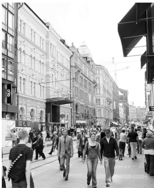
На вулицях Гельсінкі безпечно і вдень, і вночі.