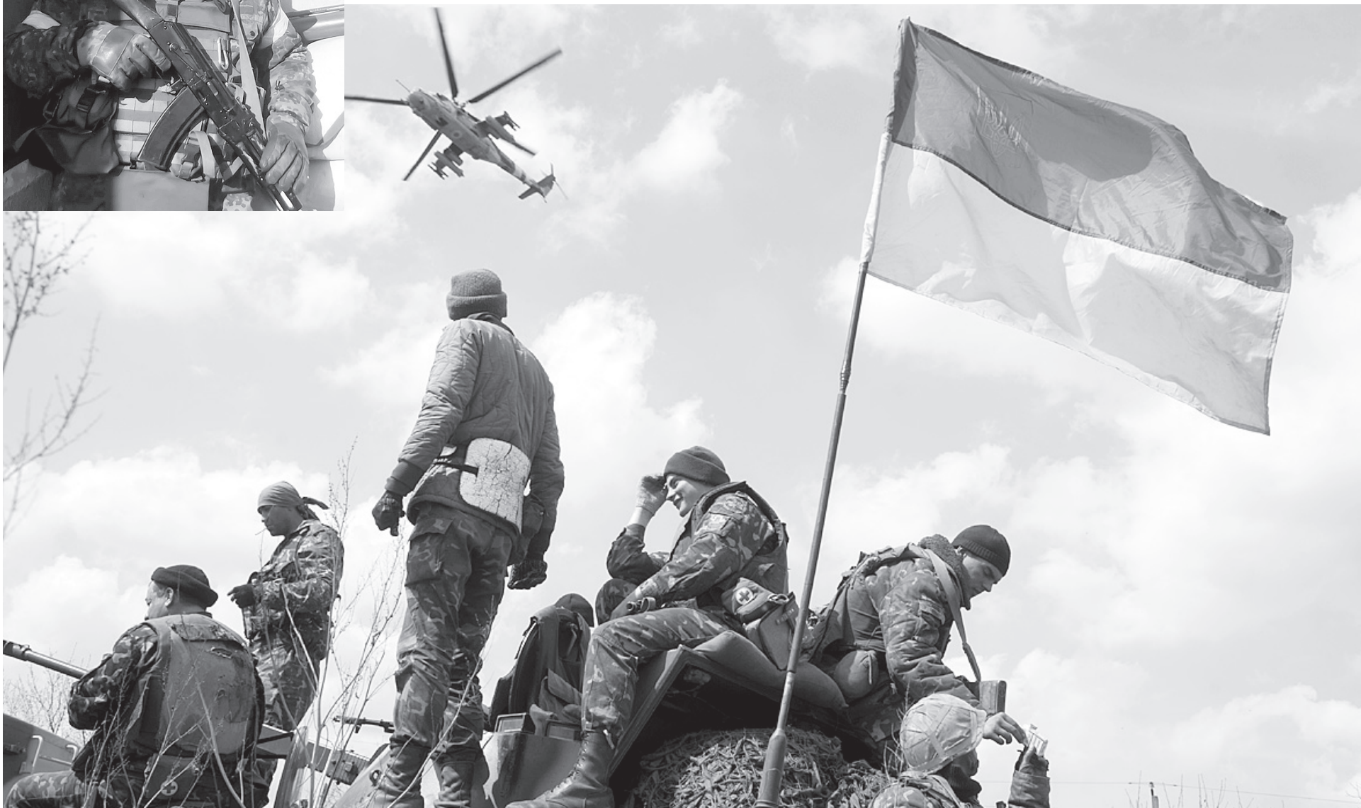
Захищати нас вони вважають своїм чоловічим обов'язком.

Передплатіть «Україну молоду» на 2017 рік