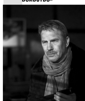
00.05 X/ф «Незвичайна подорож» 01.55 Т/с «Чорний список-2»

06.25 Факти 06.55 М/с «Пригоди мультинят» 07.50, 4.05 Стоп-10 08.45, 4.55 Провокатор 09.45 Більше ніж правда 10.40 Секретний фронт 11.40 Антизомбі 12.35, 13.00 Громадянська оборона 12.45 Факти. День 13.50 Інсайдер 14.50 X/ф «Максимальний ризик» 16.45 X/ф «Відчайдушний» 18.45 Факти. Вечір 19.20 Надзвичайні новини. Підсумки 20.05 X/ф «Викрадена-2» 21.55 X/ф «Три дні на вбивство»