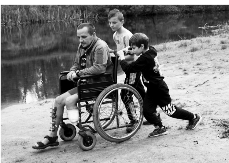
Виставка фотомайстра з Кобеляків складається з дуже болючих, пекучих знімків.

такі умови виробництва й часто працюють без вихідних. Бо прекрасно розуміють, що цегла нині — надзвичайно потрібний матеріал для відбудови України. От таких людей, які продовжують працювати в надзвичайно складний для країни час, вирішив теж показати.