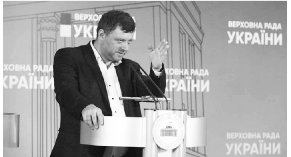
Перший віцеспікер парламенту Олександр Корнієнко вказує курс до узурпації Зе-влади

Цим і скористалось оточення глави держави, яке взяло під контроль усю його діяльність. Від їхніх текстів, ідей, пропозицій залежить його успіх, щоденні розмови з українцями