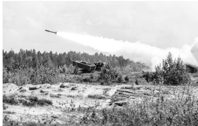
Необхідні нам HIMARS і політичному футболі США

Імовірно, Кіссінджер також є частиною певного плану президента США Джо Байдена. Адже Республіканська партія хоч і не розкололася, але дала серйозну тріщину в групі «ядерних» фанів Трампа. Його лінія кудись гезла, і він раптом втратив голос. І ніхто не озвучив його позицію, а найближчі соратники, з якими він тусить у Мар-а-Лаго, заїдалися.