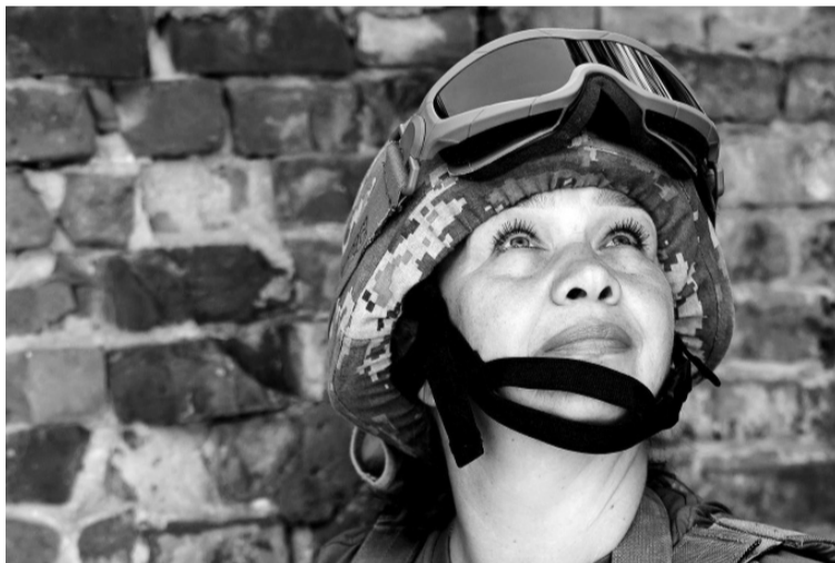
Чарівна, тендітна, мужня.

Перед війною молода сім'я вирішила розводити кіз. Нині їх у домогосподарстві 25 голів. Відколи молодий чоловік за-