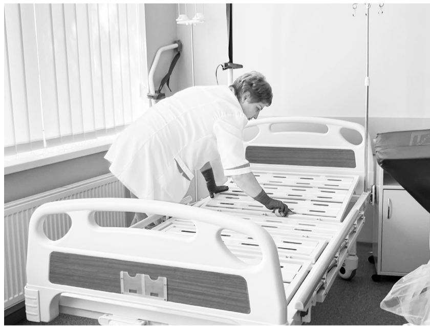
На Черкащині відділення для протезування та реабілітації військовослужбовців починає працювати вже цього тижня.

«За кошти місцевого бюджету Корсунь-Шевченківської громади